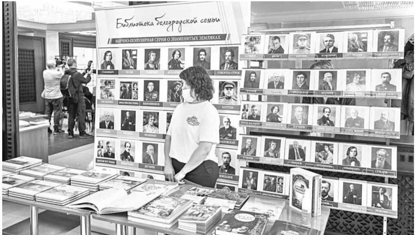
В последние годы в Белгородской области выпускается много качественных краеведческих книг, которые тоже можно изучать на уроках родной литературы

Задача нового предмета — познакомить школьников с произведениями фольклора, русской классики и современной литературы, которые не входят в список обязательных произведений, представленных в программе по предмету «Литература», но при этом максимально ярко воплотили национальную специфику русской литературы и культуры.