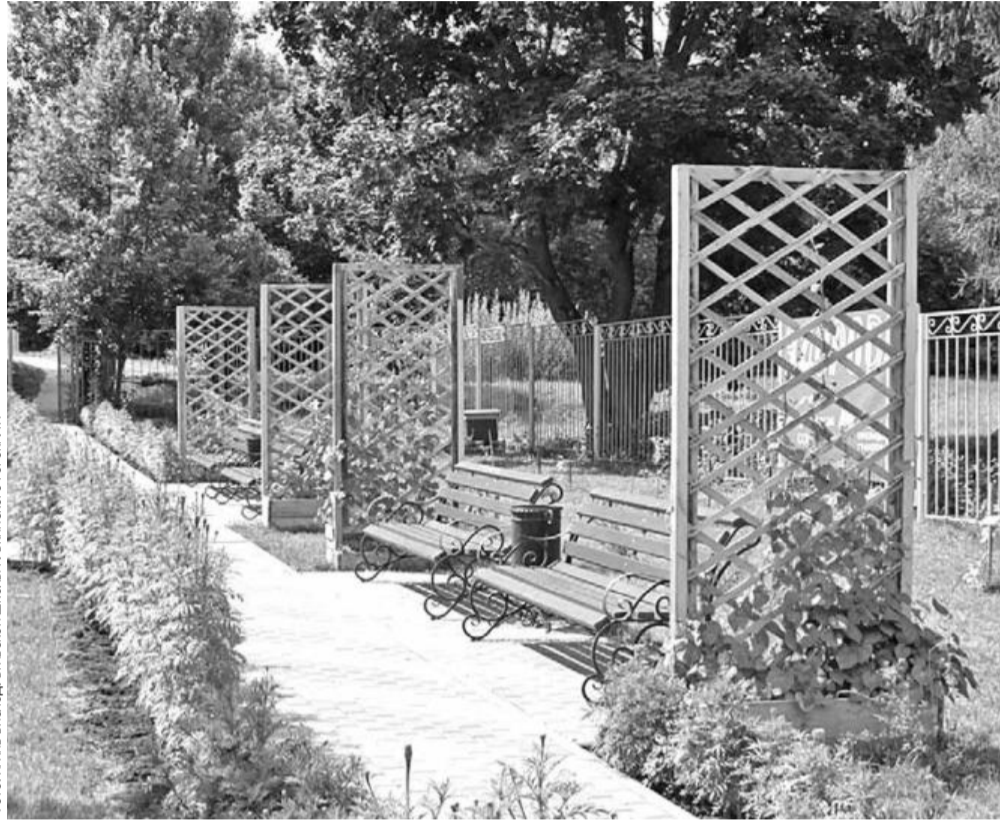
Вислудубравская школа Губкинского горокруга