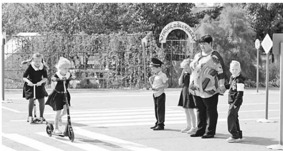
В «Автогородке» школьники на практике учат Правила дорожного движения