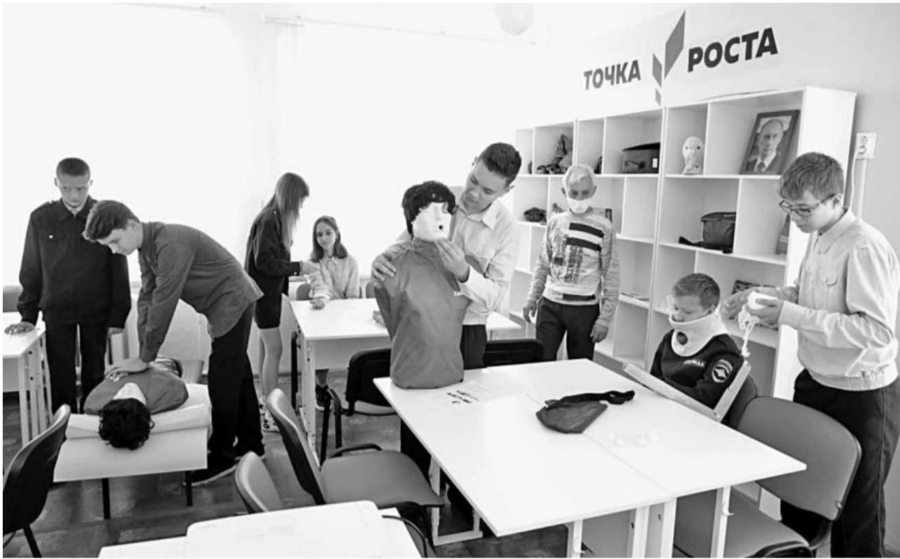
Занятия по оказанию первой медицинской помощи

Конечно, «Точкой роста» сейчас никого не удивишь. В Белгородской области уже привыкли, что даже небольшие сельские школы постепенно оснащаются современным оборудованием, а ребята учатся программировать, конструировать, управлять квадрокоптерами и легко осваивают цифровую технику.